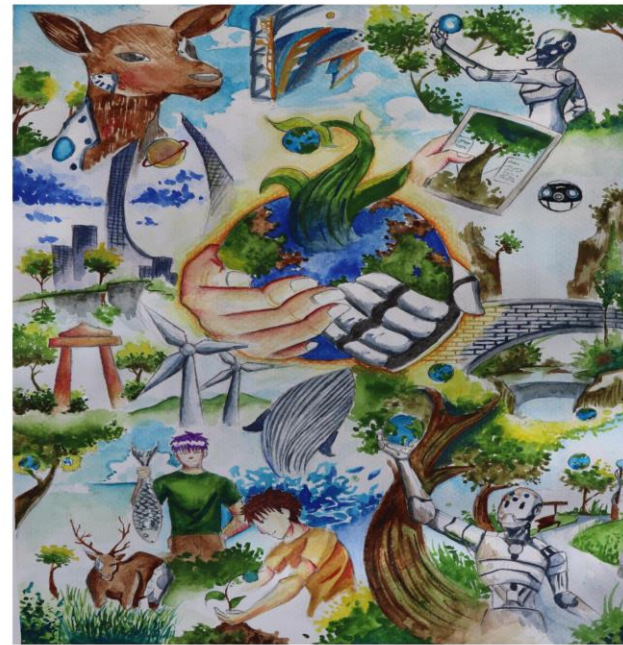
(ภาพประกอบหน้าปกโดย นายธีร เดชครอบช่วง ชั้น ม.5 โรงเรียนโพนินันท์วิทยาคม)