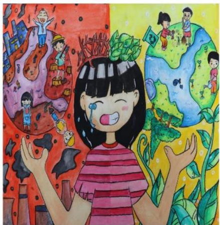
กรมส่งเสริมการค้าระหว่างประเทศ กระทรวงพาณิชย์